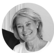
Edith de Ménibus